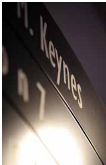
(CSIBE Sala Keynes)

Ogni giorno, il Centro è frequentato da più di 1.500 persone fra docenti e studenti dell'Ateneo di Parma, studenti e docenti di altri Atenei, professionisti e cittadini.